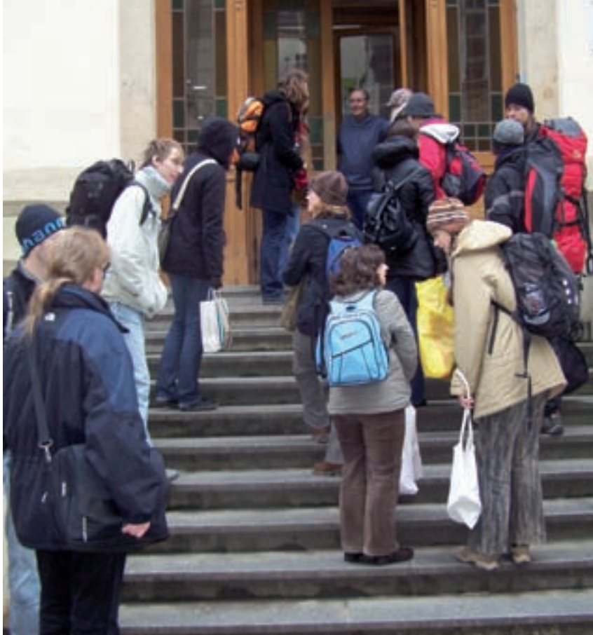
Členové divadelního spolku jdou na zkoušku.

Hamba se zrodila ze zhruba patnácti lidí z nejrůznějších oborů přírodovědecké fakulty a od začátku bylo jasné, že si neděláme ambice na profesionální, dokonce ani poloprofesionální divadelní činnost. Spojovala nás chuť do společné kreativní činnosti v přátelské neformální atmosféře, touha po večerech plných smíchu a pohody, které budou do jisté míry kompenzovat večery ostatní, strávené nad skripty a učebnicemi plnými vzorečků a grafů. Z toho důvodu velmi brzy padly nápady jako třeba sehnat režiséra, který by nás „odborně“ řídil. Již od ustanovení názvu, o kterém je dnes jisto pouze to, že se vynořil odněkud z hlubin fenomenálního brainstormingu jedné z počátečních schůzek, se začalo ukazovat, že hybnou silou je společný konsensus a autorita jednotlivých členů, kterou si získají u ostatních.