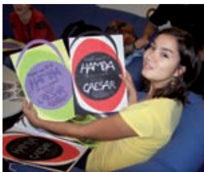
Plakáty si Hamba vyrábí sama.

Hamba se tak ustanovila jako přátelský kolektiv, který bere divadlo především jako koníček ve volném čase. Návrhy a koncepce jsou společně předkládány, posuzovány i řešeny, často sice kvůli této demokratické cestě dosti dlouho a dosti neefektivně, ale zato k výsledné spokojenosti všech zúčastněných. Typickým rysem